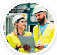
CELULOSA Y CORRUGADOS DE SONORA S.A. DE C.V.

Fue una muy buena capacitación la que desempeñó el instructor quien ha demostrado ser una persona con mucha experiencia y capaz en el tema de mantenimiento que me impartió. Espero aplicar en mi trabajo las herramientas que me proporcionó y obtener los beneficios de esta.